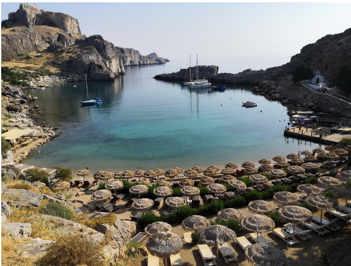
Zatoka Świętego Pawła

Wejście do zatoki ma około 30 m szerokości i znajduje się w północnej części akwenu. Jest to najgłębsza część tego zbiornika wodnego (6 metrów). Dalej w kierunku południowym zatoka szybko się wypłyca i kilkadziesiąt metrów od wejścia do zatoki woda ma już tylko 2 metry głębokości. Środkowa część zatoki ma głębokość od 1,5 do 2 metrów. Rano woda w zatoce jest przejrzysta i widoczność wynosi około 30 metrów. Nad zatoką znajdują się dwie plaże i osoby korzystające z nich unoszą osady z dna. W związku z tym w sezonie, około południa, widoczność spada do 10 metrów. Dno zatoki jest piaszczyste, a w wielu miejscach na dnie zalegają duże kamienie i głazy. W lipcu temperatura wody w zatoce wynosiła 28°C. Dzięki tym warunkom zatoka nadaje się do prowadzenia szkoleń nurkowych. W zatoce znajduje się betonowy pirs umożliwiający przybijanie łodzi oraz mała przystań. Około 40 metrów od wejścia do zatoki przeprowadzony jest w poprzek gumowy wąż (zaznaczony na czarno na rysunku), prawdopodobnie doprowadzający wodę do jachtów zacumowanych po wschodniej stronie. Na środku zatoki wąż znajduje się w toni, około 0,5 metra nad dnem. Na dnie, w pobliżu jachtów zacumowanych po wschodniej stronie zatoki, znajduje się porzucona duża kotwica z grubym łańcuchem kotwicznym (długości około 25 metrów), zaplątanym w głazy i kamienie.