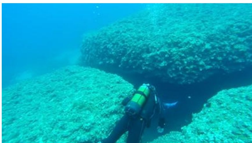
W wejście do pierwszego tunelu (9 metrów długości)