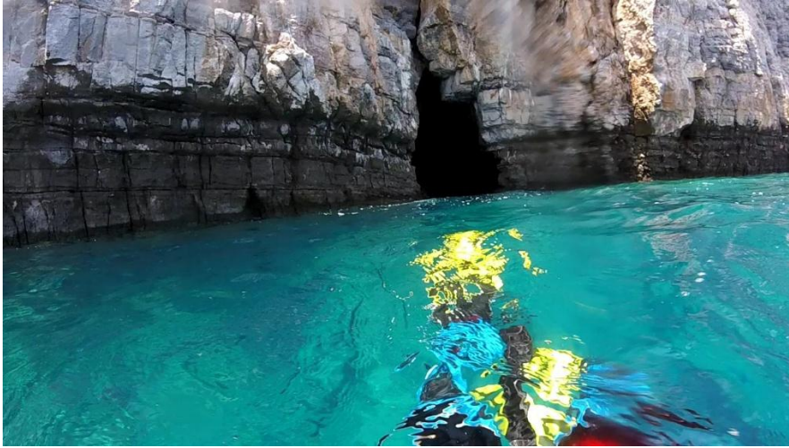
Jaskinia nad wodą

Poza zatoką widoczność w morzu wynosi 50 metrów (lipiec), a temperatura wody 28°C przy powierzchni i 24°C na głębokości 20 metrów.