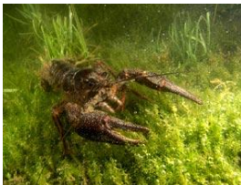
Rak Polski zdj. Nurkomania