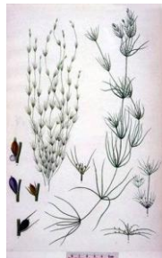
Ramienica krucha ( Charophyta )