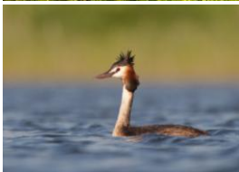
Perkoz dwuczuby